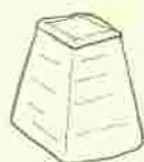
COMPOSTER CON RETE