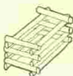
LA CASSA DI COMPOSTAGGIO